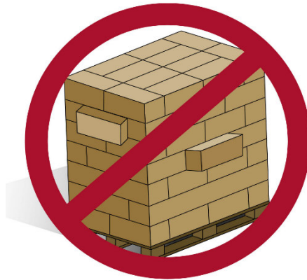
Abbildung: Palette mit Überständen